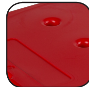
Zone de marquage