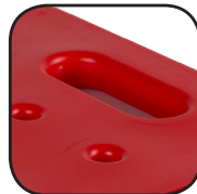
Poignée de portage