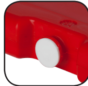
Bouchon soudé par ultrasons